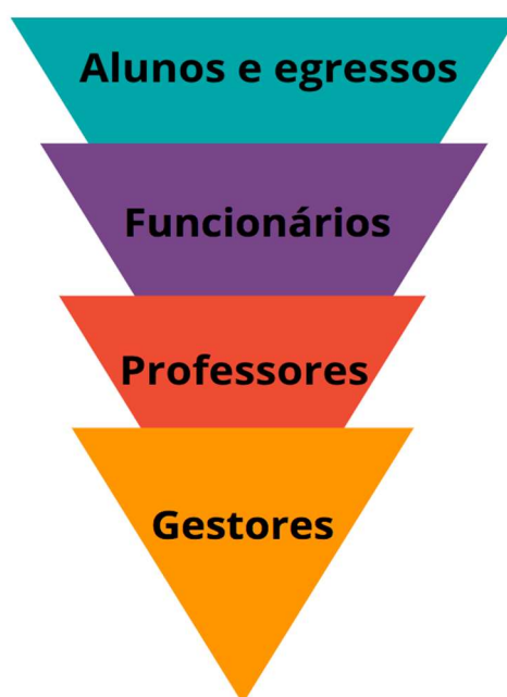
Figura 2 - Efeito de sensibilização em camadas

O ponto focal do processo serão os gestores da área administrativa e coordenadores da área acadêmica, entendo que os melhores resultados, tanto quantitativos quanto qualitativos, são resultados de ações multiplicadoras obtidas pela conscientização de pessoas que influenciam um grupo maior.